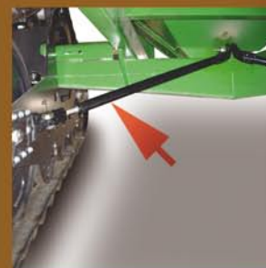
Bras anti-torsion simple s'adaptant à la majorité des remorques à grains.