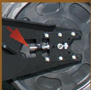
Ajustement de la tension de la chenille simple et accessible.

La flottabilité supérieure de notre système de chenilles, comparativement aux pneus, vous permettra d'accéder aux champs même dans les conditions les plus difficiles de sol très mou. Il fera également preuve d'une grande stabilité en sols inégaux.