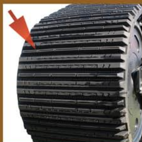
Profil des chenilles conçu pour la flottaison et la charge.