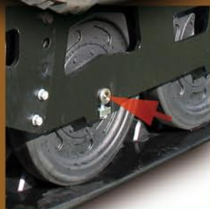
Lubrification des essieux à la graisse pour une durée de vie prolongée.